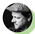
Dominique Pichard Photographe intervenant